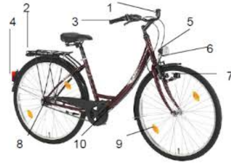
Bicicleta y sus partes.