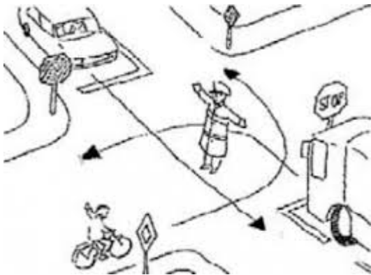
Ejemplo de cómo debe conducir en la carretera.